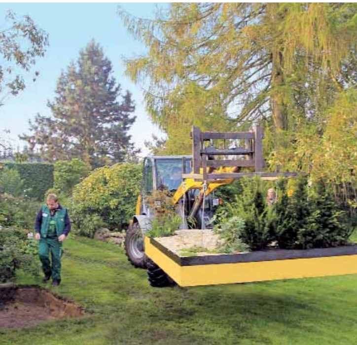
In bereits vorhandenen Gärten oder bei der Garten-Neuanlage: Per Radlager oder Kran lassen sich die Garten-Inseln exakt platzieren.